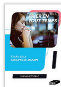
Prier en tout temps. Manuel animateur