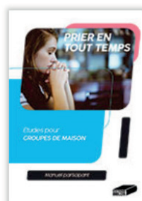
Prier en tout temps. Manuel participant

Par cette lettre nous souhaitons vous encourager à persévérer dans votre vie de prière et nous vous présentons ce nouveau guide simple, pratique et inspirant pour grandir ensemble et apprendre à prier en tout temps.